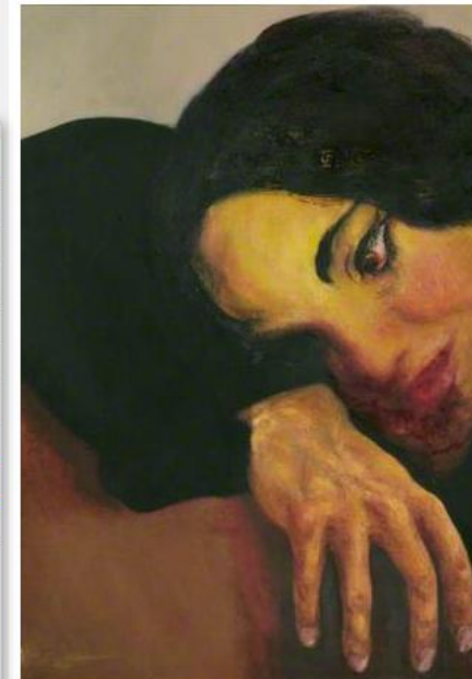
Hambling, Maggi 1945 oil on cotton duck 54.7 x 58 cm

Rugby Art Gallery and Museum Art Collections © the artist/Bridgeman Art Library Photo credit: Rugby Art Gallery and Museum Art Col