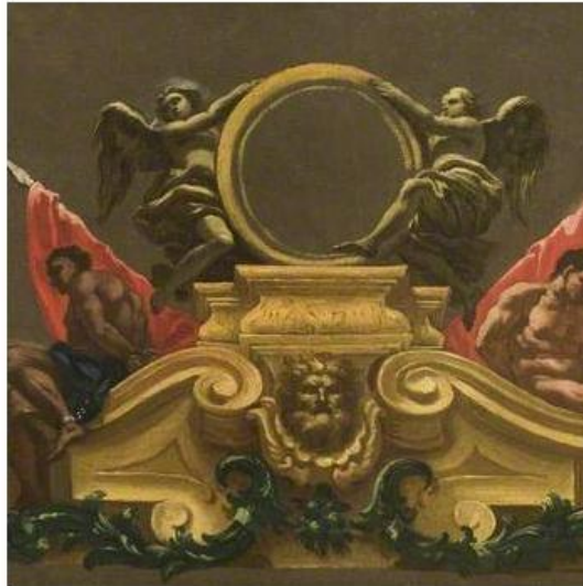
Italian (Neapolitan) School oil on canvas 35 x 48.3 cm

Cecil Higgins Art Gallery